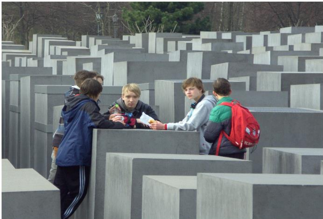
und zum Holocaust-Mahnmal