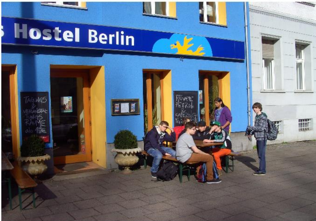
und vor unserem Hostel