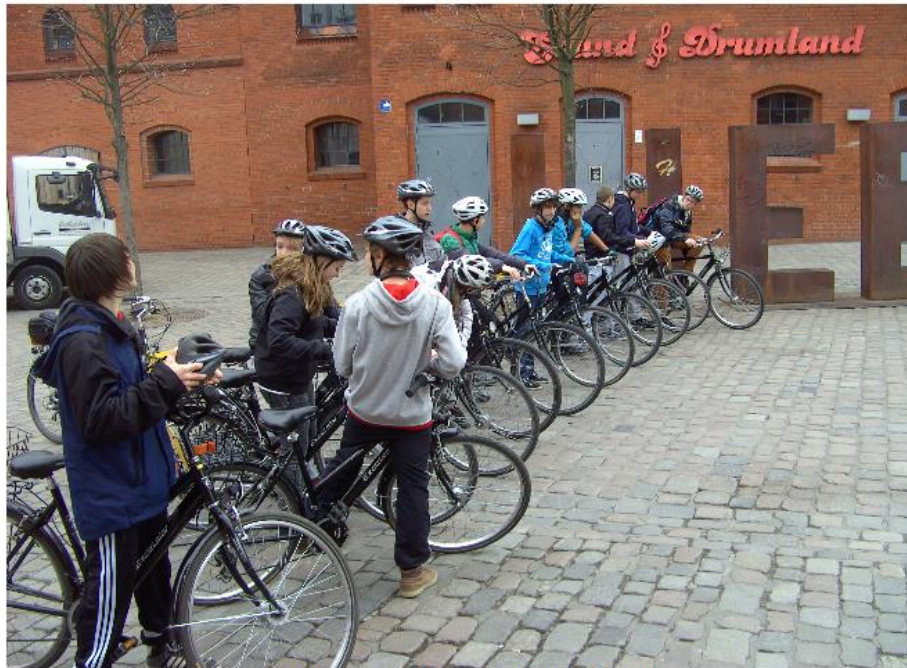
mit dem Fahrrad durch Berlin