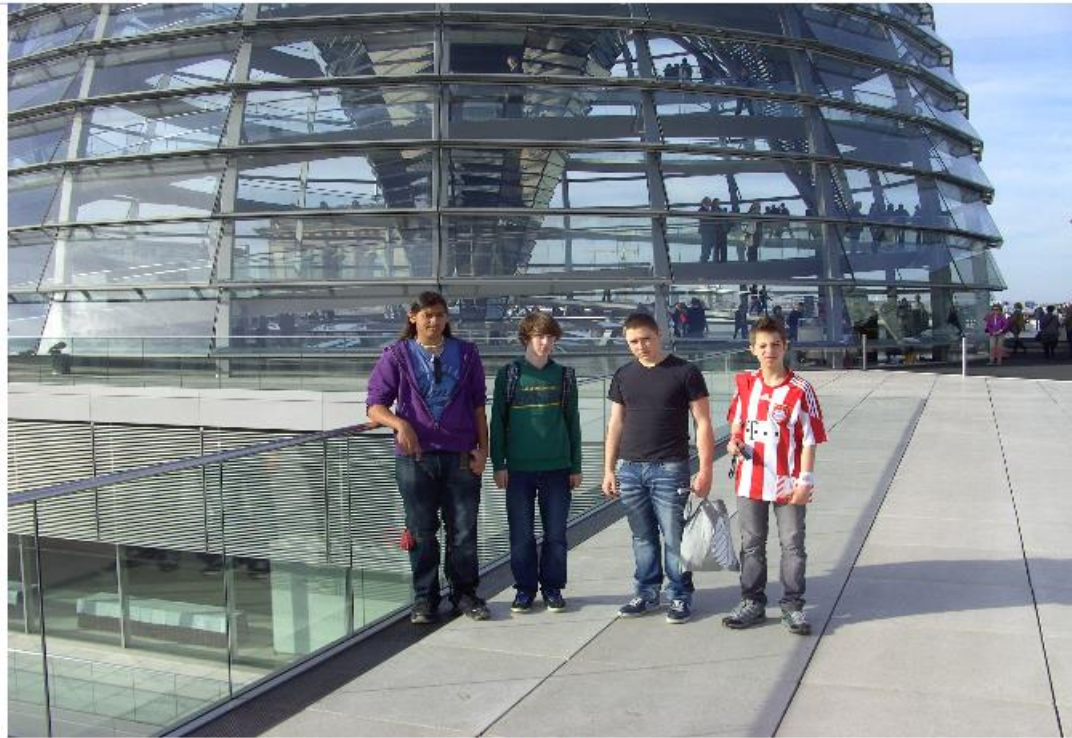
auf und ...