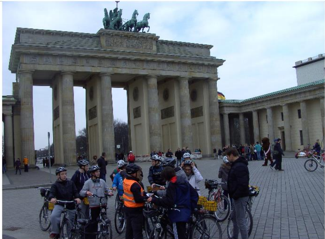
ans Brandenburger Tor