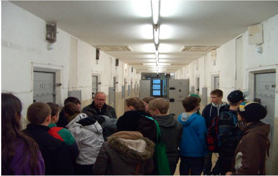
im ehemaligen Stasi-Gefängnis